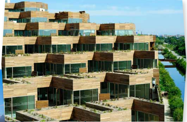
VM Bjerget i Ørestaden