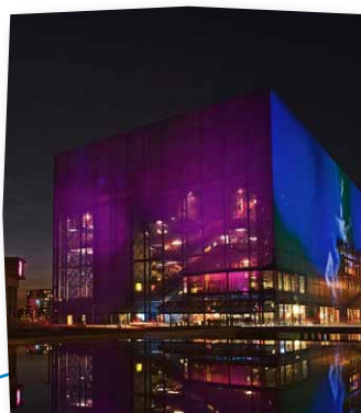
DR's koncerthus i Ørestaden

Sveriges Allmännyttiga Bostadsföretag, (SABO) Vasagatan 8-10, Box 474, SE-101 29 Stockholm Tel: 46-8 406 55 00. Fax: 46-8 20 99 04