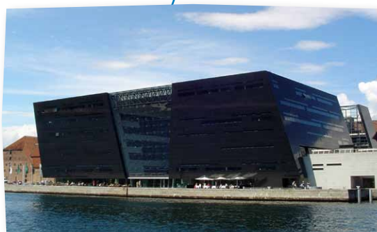
Diamanten (Det Kongelige Bibliotek)