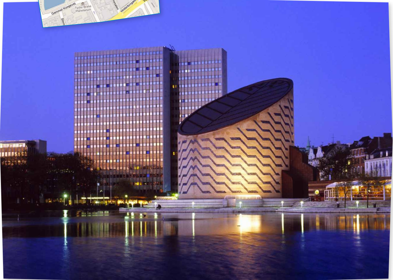
Scandic Hotel Copenhagen