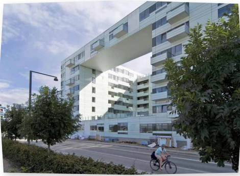
Brohuset i Ørestaden